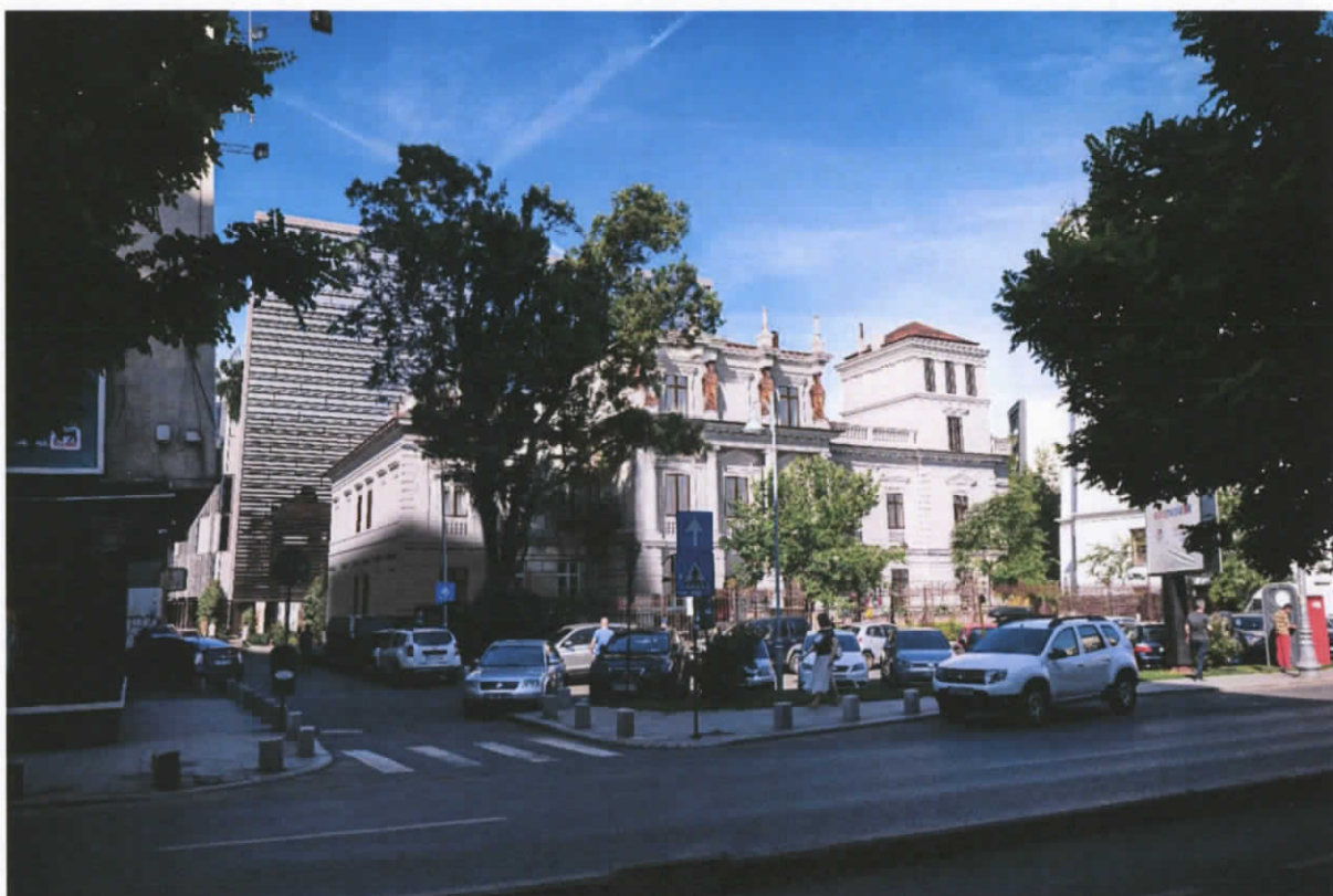
Relatie palat - cladire propusa

Imagine frontala asupra Palatului dinspre Calea Victoriei nu este alterata de volumul neutru propus, retras la aproximativ 17 m de palat, perceptia de la nivelul ochiului sustine acest punct de vedere.